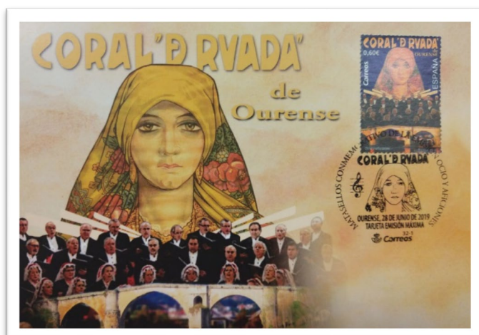
Tarjeta Máxima Coral Ruada 2019