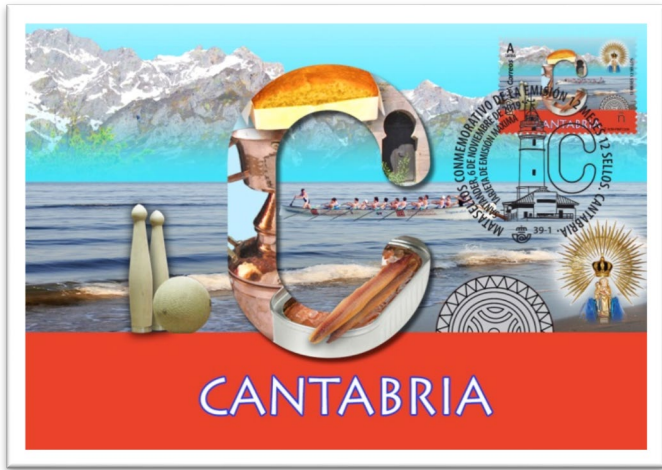
Tarjeta Máxima Cantabria 2019